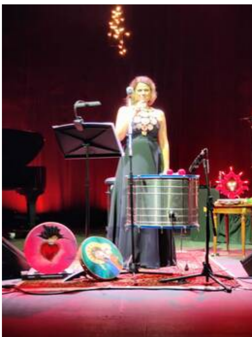
Tosca durante el show del sábado por la noche

El evento fue organizado por el Consulado General de Italia en Buenos Aires, como contribución italiana al Día Internacional de la ONU para la Eliminación de la Violencia contra la Mujer, apoyado por Italia como parte de su tradicional compromiso contra todas las formas de discriminación y violencia de género.