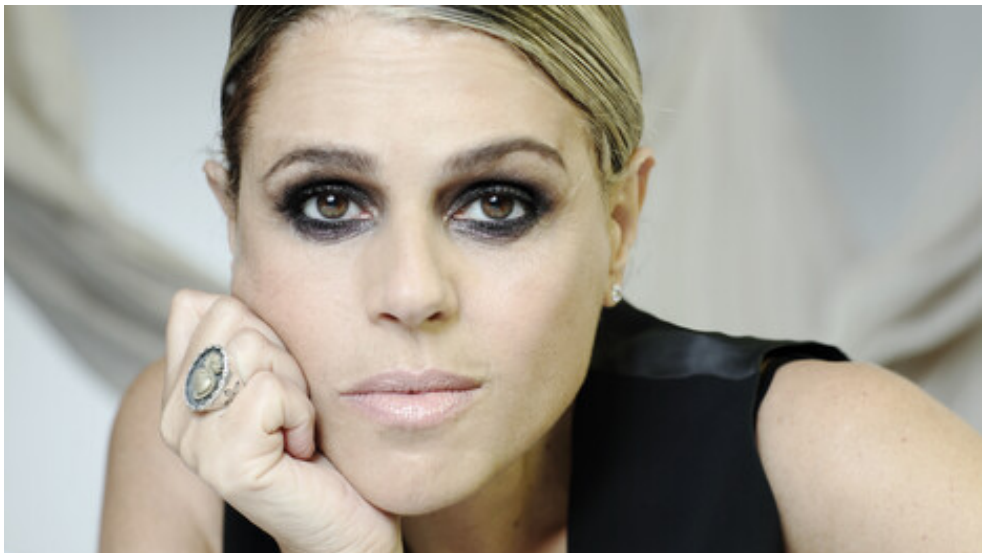
La cantante italiana Tosca