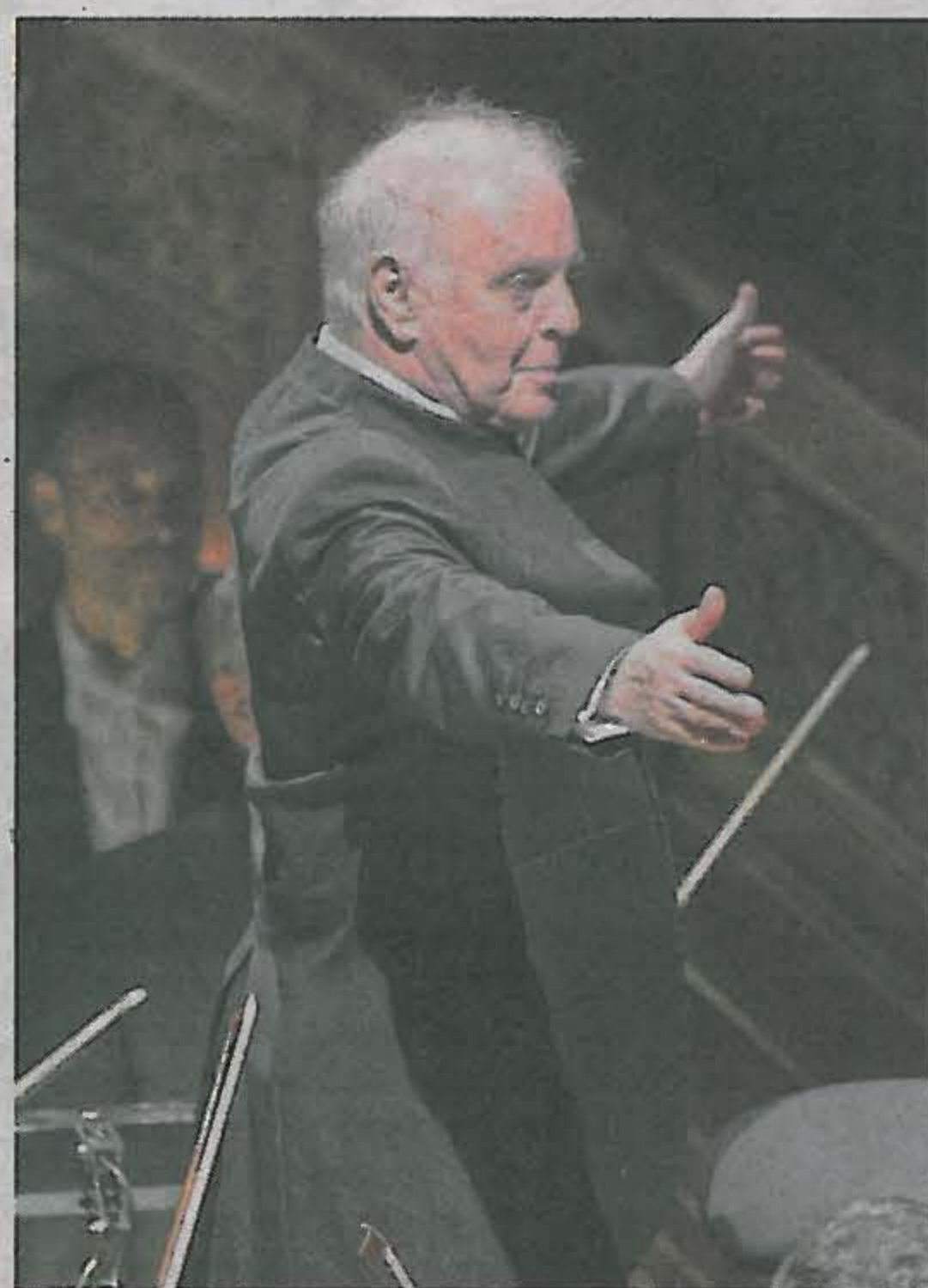
Una imagen que no se había visto antes: el maestro argentino en el foso del Colón