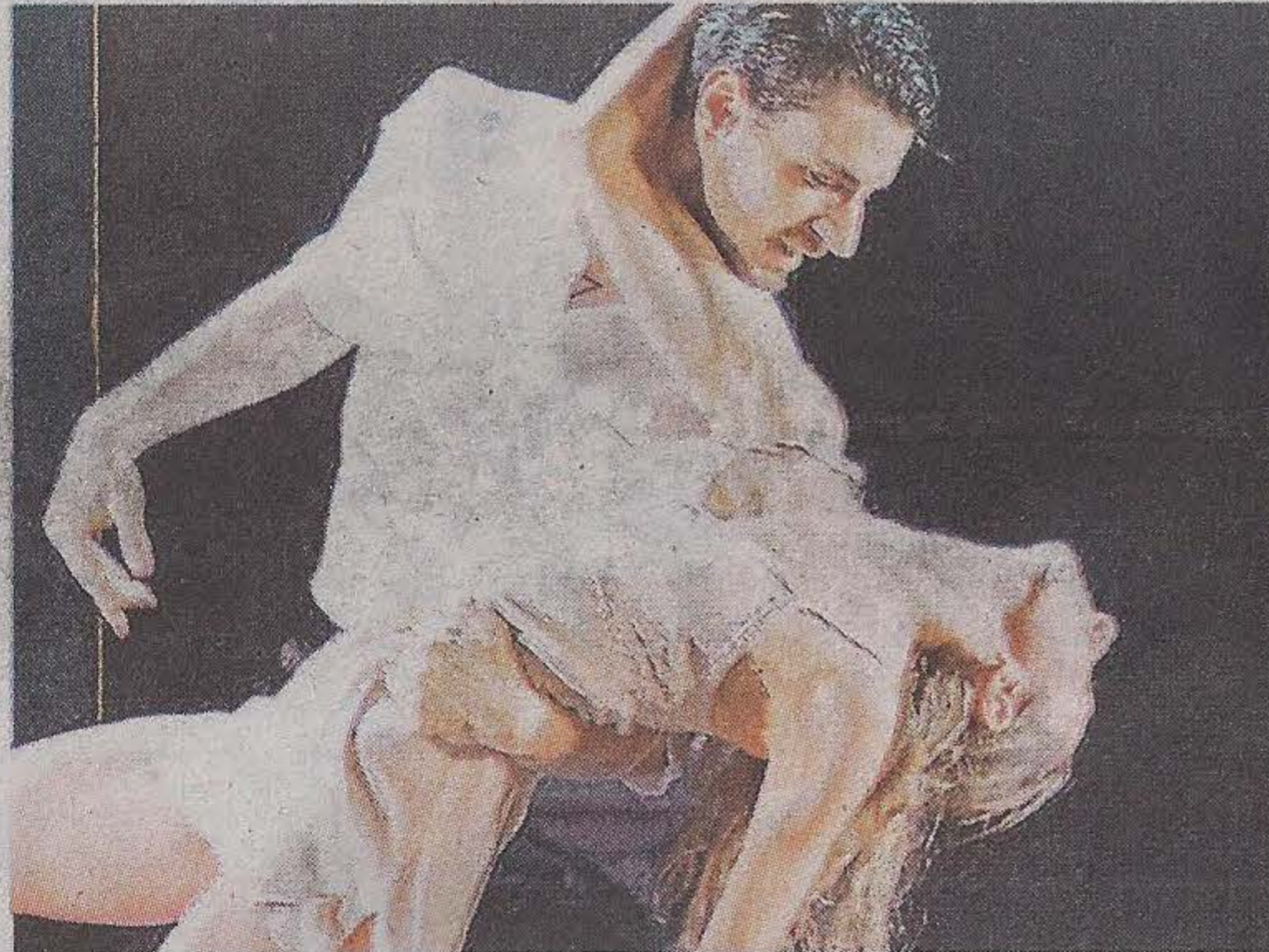
Los amantes de Verona. En una puesta distinta y "matriarcal".

Las versiones para danza de la popularísima tragedia shakesperiana son prácticamente incontables y siempre reflejan el punto de vista de