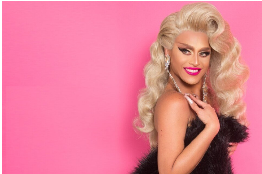
► Sasha Colby

¿Volverá Sasha Velour a participar en Rupaul Drag Race ? El reality que tiene quince temporadas ya emitidas cuenta con un formato de All Stars donde las participantes que no se llevaron la corona pueden regresar para una segunda oportunidad. Este año se realizó una edición especial de este repechaje pero con competidoras que ya habían ganado sus respectivas temporadas. Este cambio de juego resultó interesante para la ganadora de la temporada 9, en especial porque la última temporada norteamericana la ganó otra reina y amiga de Velour: Sasha Colby , quien brindó en su paso por el programa espectáculos de alta calidad y mensajes políticos muy poderosos. Entonces imaginar a las dos Sasha juntas podría hacer que acceda. “Fue muy divertido (participar) la primera vez, amo hacer drag y amo llevarme a nuevos desafíos, así que tomaría cualquier oportunidad”, dice dejando una gran puerta (¿al Werk Room?) abierta.