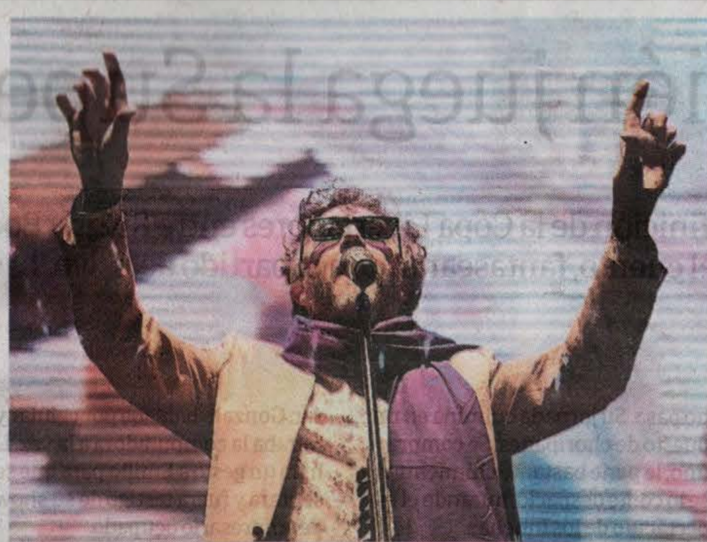
Fito Páez. Se presenta por primera vez en el Lollapalooza.

Sin duda alguna, la presencia de La Mona Jiménez en la programación del Lollapalooza Argentina 2019 merece un párrafo aparte. El cantante tomará la posta que dejó Pablo Lescano, quien en la edición 2018 del encuentro puso a bailar a una multitud bajo la luz del sol. Ciertamente, el cuartetero cordobés será uno de los imperdibles de la programación.