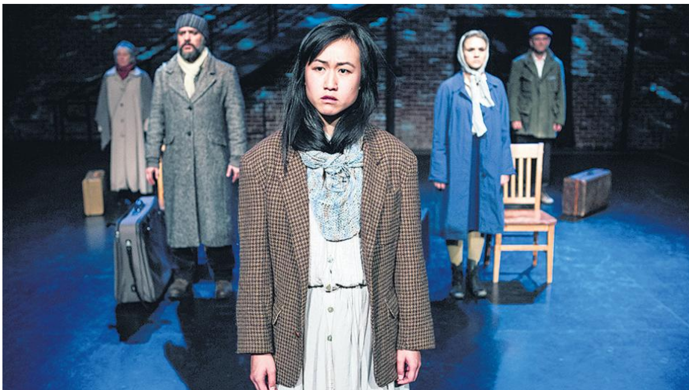
The New Colossus (Estados Unidos), del actor y director Tim Robbins, abrirá el encuentro.