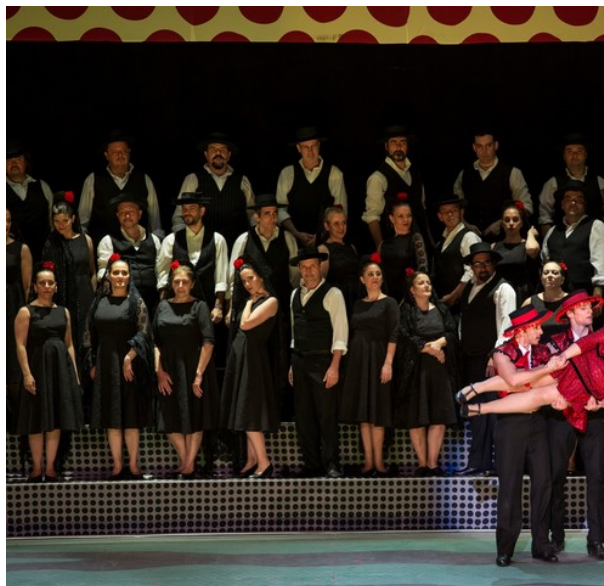
La puesta está a tono con la coreografía del musical de Broadway.

Al derroche de historias y geografías que derivan de un pastiche de excesos que es la partitura, la puesta en escena de Szuchmacher responde con una economía admirable. En los finales de la década del '50, en los comienzos de los vestuarios despojados, tan a tono con la coreografía de Broadway.