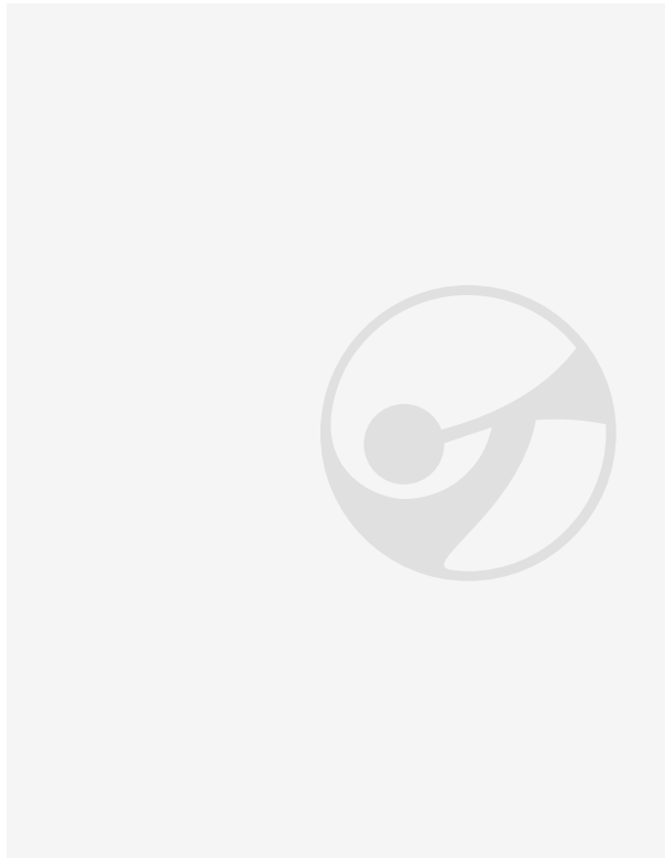
Ilusiones ópticas y colores saturados caracterizan la puesta de la producción que se presenta en el Teatro Coliseo.

NS_CAMPAIGN=CLARIN...&NS_SOURCE=AGEAMKT&NS_LINKNA...&NS_BUTTON=&NS_FEE=0.01)