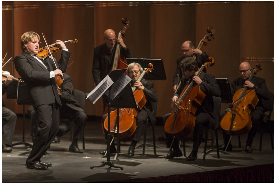
La Orquesta del Teatro Regio Torino con Sergey Galaktionov como solista y director, Nuova Harmonia, Teatro Coliseo 2017

Así, por ejemplo, en el comienzo de "Primavera 1" —si no mal recuerdo en la interpretación de los turineses no se interpretó la breve introducción grabada "Primavera 0"— el motivo del primer episodio del "Allegro" vivaldiano se multiplicaba en los diferentes atriles de los violines, mientras las violas, violoncellos, contrabajos y el arpa creaban un sostén armónico oscuro típico de las composiciones de Richter , contraponiendo la virtuosa actividad al bello estatismo sonoro, aquí muy bien lograda por los italianos.