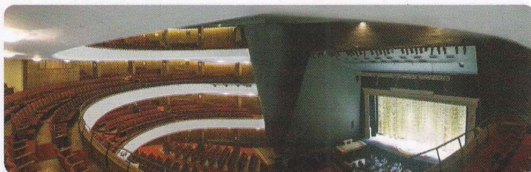
La caja escénica, única en el mercado