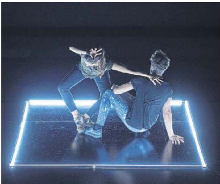
Caravana , otra de las propuestas de la muestra