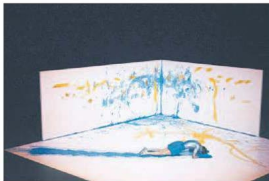
Endo , del francés David Wampach