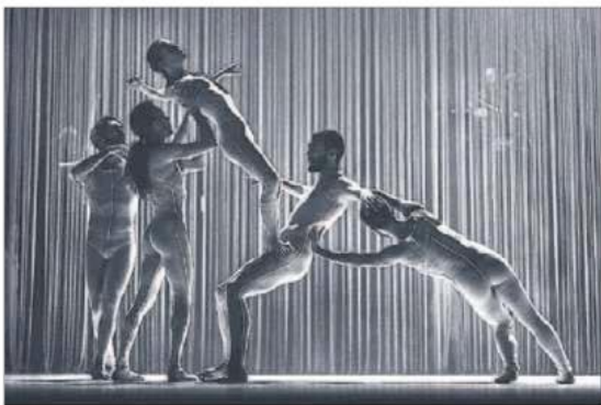
I am beautiful , de la Compagnia Zappalà