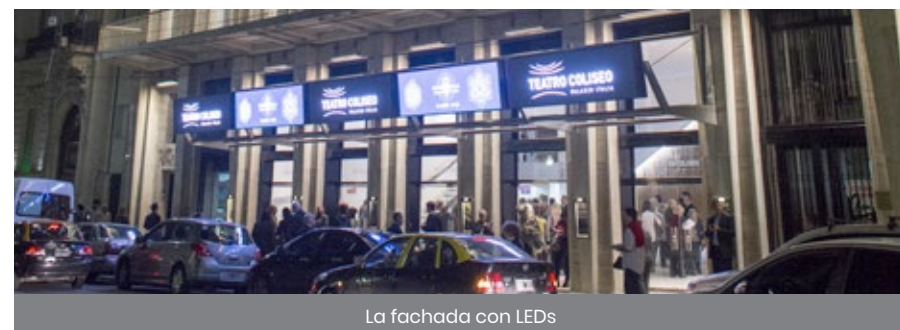
La fachada con LEDs

Así retomó el trabajo con diferentes productoras, a las que ofrece un público habitual de buen poder adquisitivo. Con sus 1800 butacas, tiene una capacidad importante detrás del Teatro Gran Rex y del Opera en Capital Federal, pero lo superaría en su ubicación, contigua pero fuera del microcentro. Los productores reciben además del teatro un pack de servicios con el mayor nivel técnico en sonido e iluminación, y la exposición con las nuevas pantallas de LED. En todo este proceso de management moderno cuenta con el apoyo y el