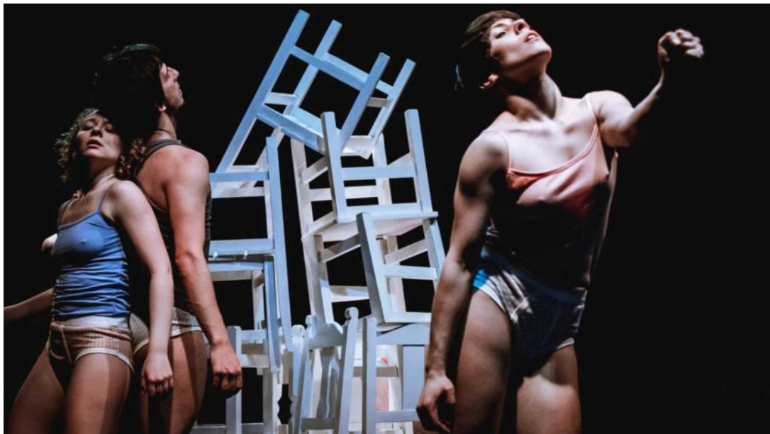
Leidenschaft. Tres cuentos escénicos sobre el amor, la locura y la muerte. | FOTO: PAOLA EVELINA GALLARATO |