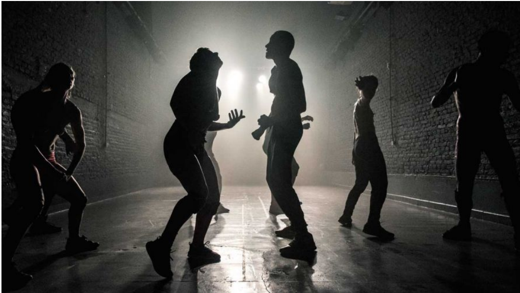
Coreomanía. No puedo parar.