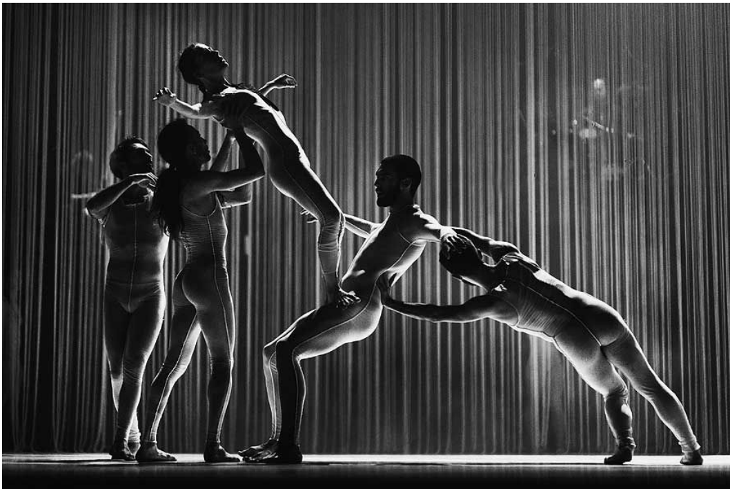
I am beautiful (Italia). Compagnia Zappalà Danza. 4ª etapa del proyecto Transiti Humanitatis.

Las entradas se puede reservar en buenosaires.gov.ar/festivales . Sólo se reservará una entrada por persona y por función, y podrán retirarse desde dos horas antes del inicio de cada función en el Puesto de Informes de cada sede.