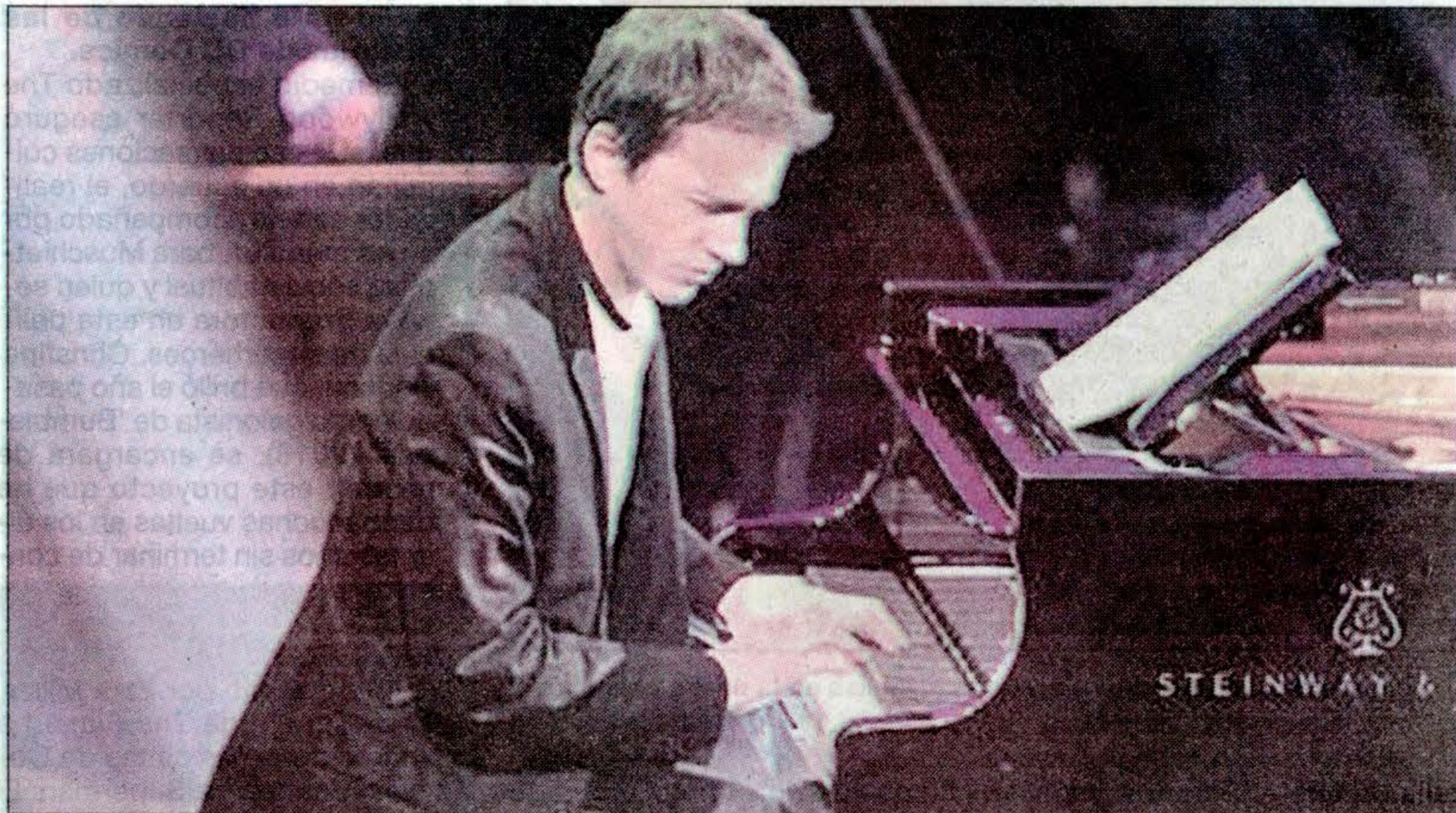
Un filme del pianista tocando en una casona abandonada precedió a su actuación en vivo en el Coliseo.

De manera que la primera parte del programa que comenta-