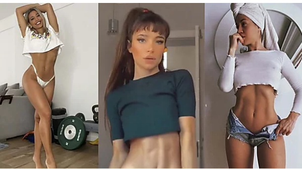
De Brenda Asnicar a Jimena Barón: los cuerpos imaginarios de Instagram Revista Noticias