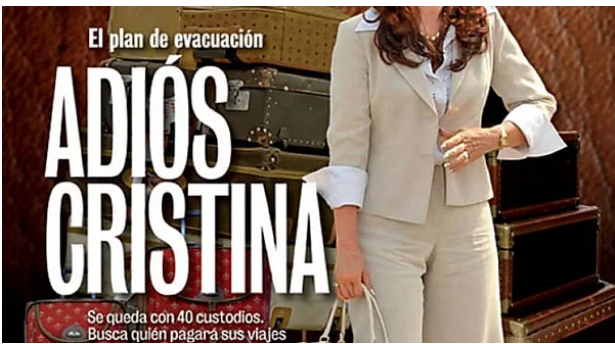
Adiós Cristina Revista Noticias