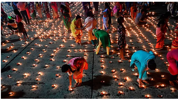
El día en fotos Revista Noticias