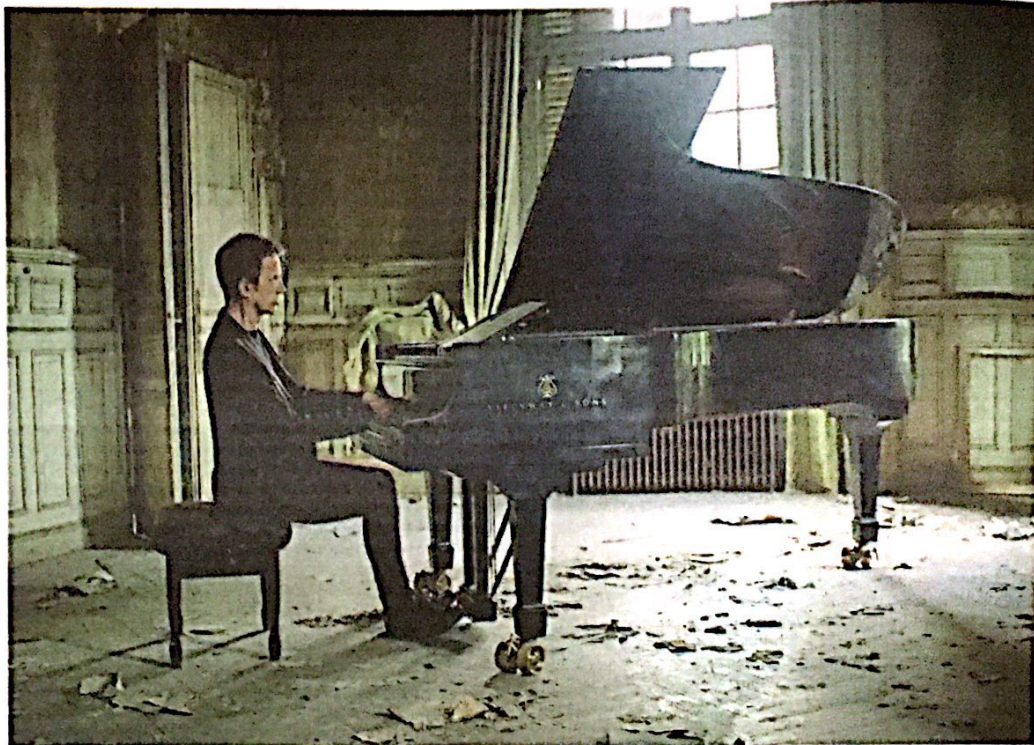
Nante eligió como escenario para las obras tardías de Beethoven los interiores de distintos castillos abandonados en las afueras de Francia.

Tocar de memoria fue un tormento para muchos pianistas, pero Tharaud no tiene complejos en presentarse con la partitura en los conciertos. Él mismo lo confiesa con detalle en su libro: "Un violinista se fusiona con su instrumento, sus partituras pueden considerarse un accesorio. El pianista viaja muy lejos de su instrumento, sus partituras son su principal anclaje físico con el concierto próximo. La partitura lo es todo, también mi compañera de escena porque nunca toco de memoria".