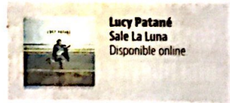
Lucy Patané Sale la Luna Disponible online

y películas de Mathieu Orcel. Una especie de mujer orquesta que, sin embargo, necesitó frenar la marcha para escuchar mejor los latidos internos.