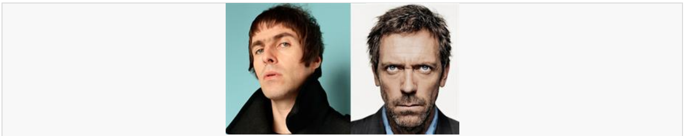
La salida de Gran Bretaña de la Unión Europea: la reacción de los artistas