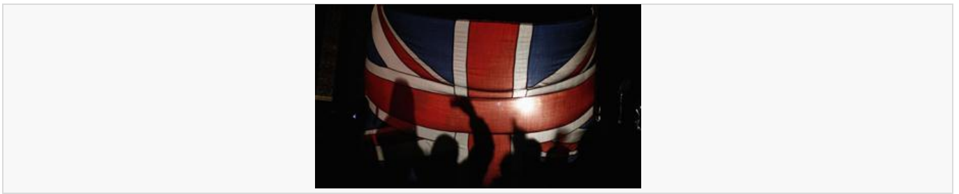
Enigmático tuit de los isleños de Malvinas: '«Falklands tomará control de la Argentina tras el Brexit»'