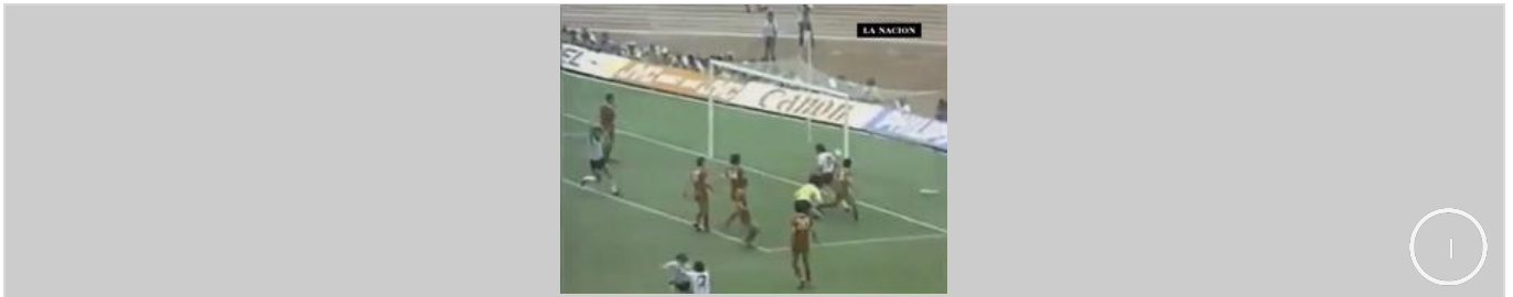
Se filtró un 2do audio de Maradona hablando sobre el mundial 86