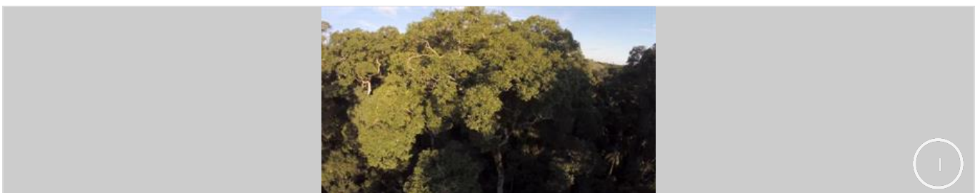
Presentación del billete de 500 pesos