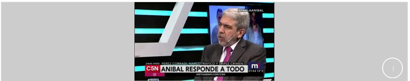
Anibal Fernandez "Quiero enfrentar a Macri"