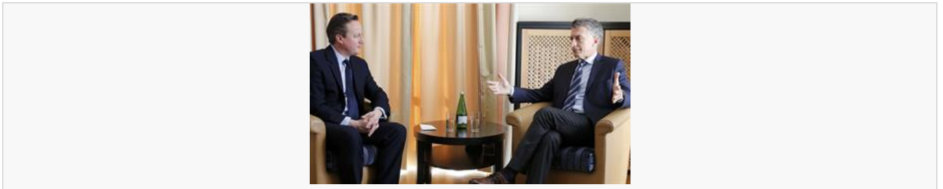
En qué afecta a la Argentina la salida de Inglaterra de la Unión Europea